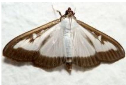
Cydalima perspectalis