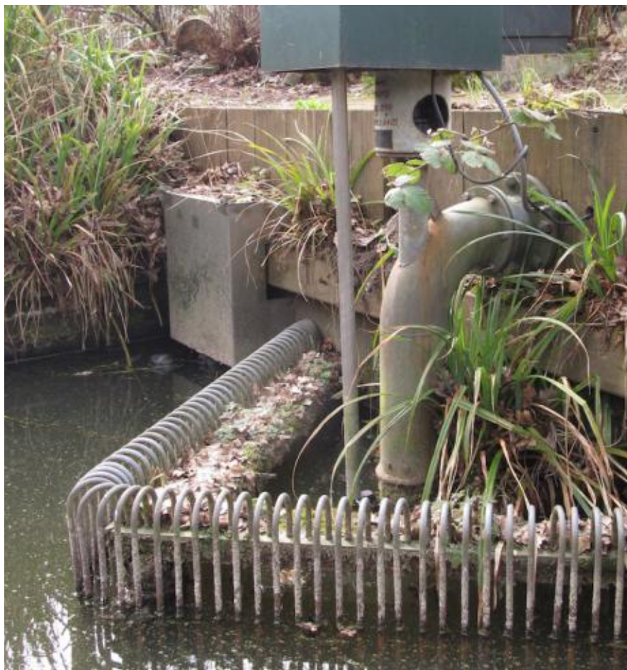
waterloopkundige installatie in Ons Buiten

Aanmelden: leorene.lentz@gmail.com (maximaal 20 deelnemers)