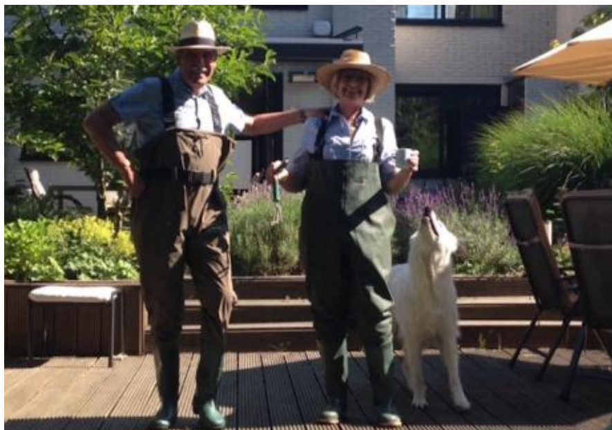
Puck en Fred van de Kartinistraat

De geplande ledenraadpleging zal daarom een half uur eerder beginnen: 14.30 uur.