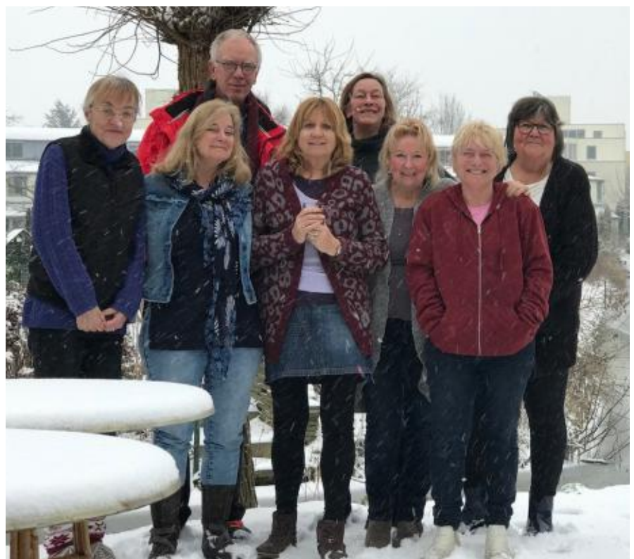
de schilderclub ten voeten uit

Op 4 en 5 mei exposeert de schilderclub in het Buitenhuis