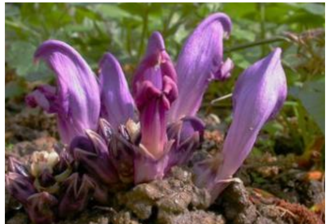
Paarse Schubwortel ( Lathraea clandestina )

De komende ALV is op Zaterdag 13 april om 16.00 uur. Aansluitend is er een borrel.